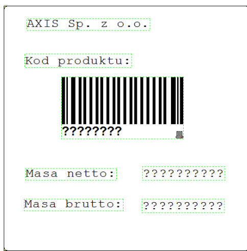
Widok gotowego projektu etykiety w programie ZebraDesigner